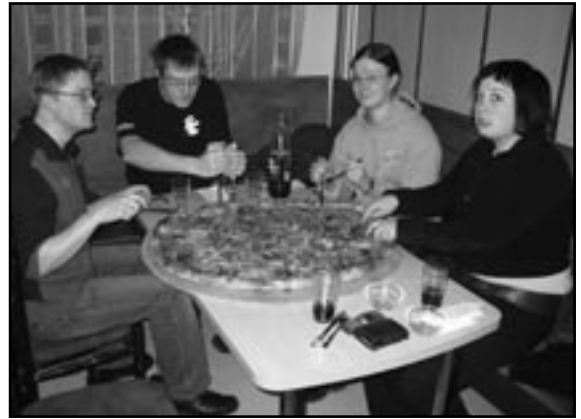
Tämä pizza on kuin OTYn vaalikokous: alussa tuntui hyvältä, mutta lopussa kävi *ituttamaan.

Ilane: Pizzasta puuttu oregano, huijausta.