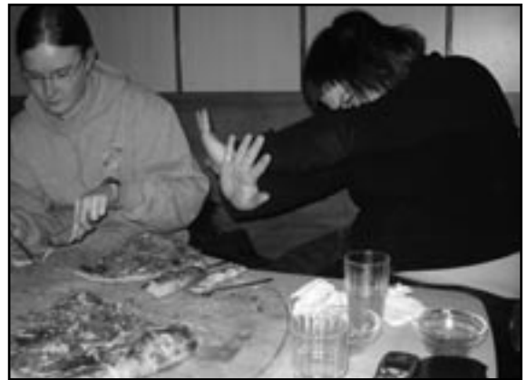
Jyrkkä EI pizzalle.

Lapset älkää kokeilko tätä kotona, tämän testin tekijät olivat rautaisia ammattilaisia, ja silti hyytyivät loppumetreillä.