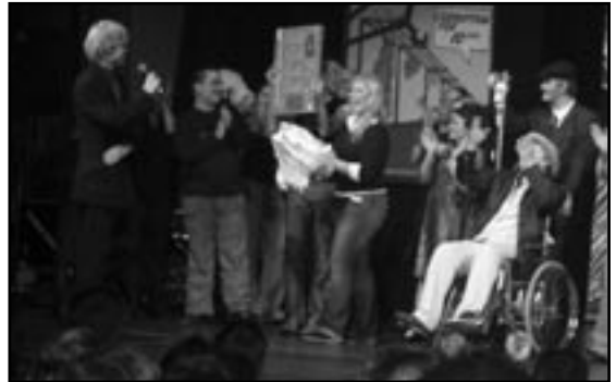
Paketista paljastuu uhkapelien kuningas - Ruletti!