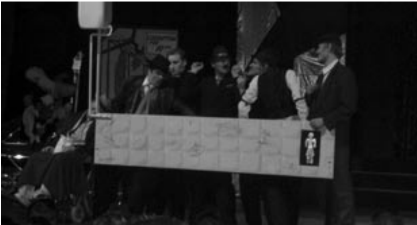
Tungosta urinaalilla - vessahuumoriakaan ei unohdettu.