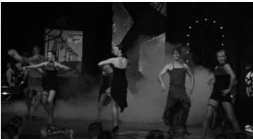
Vanhoja, mutta aina niin naurattavia vitsejä - miehiä pukeutuneina naisiksi. Gangsteriperheen pojat tanssittyttöjen seassa.