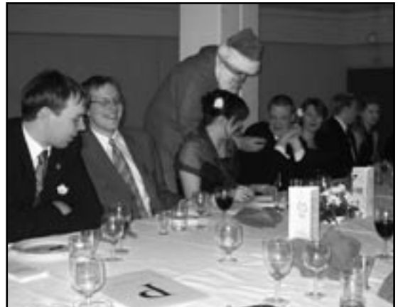
Joulupukkikin kävi kylässä.