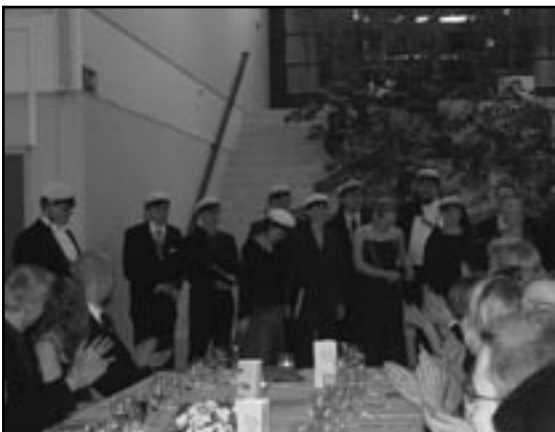
TeeKu esiintyi alkuillasta, ennen jatkoille lähtöä tansseja säestivät Teekkaritorvet.