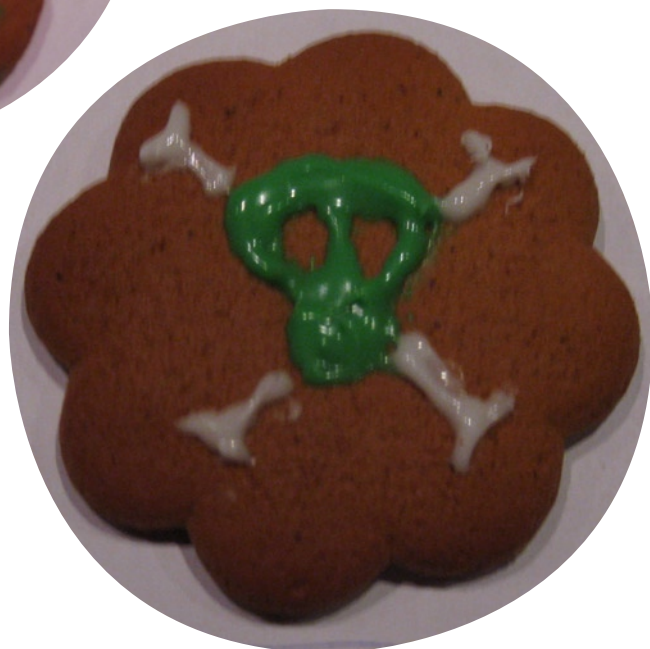
“MYRKYLLISTÄ!” Pasi Pyyppönen