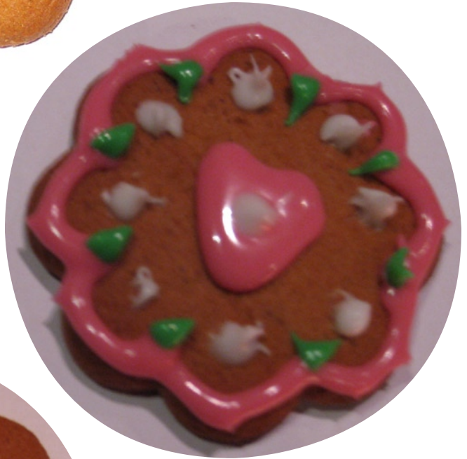
“Pipari on joulun sydän <3” Heini Pekkala