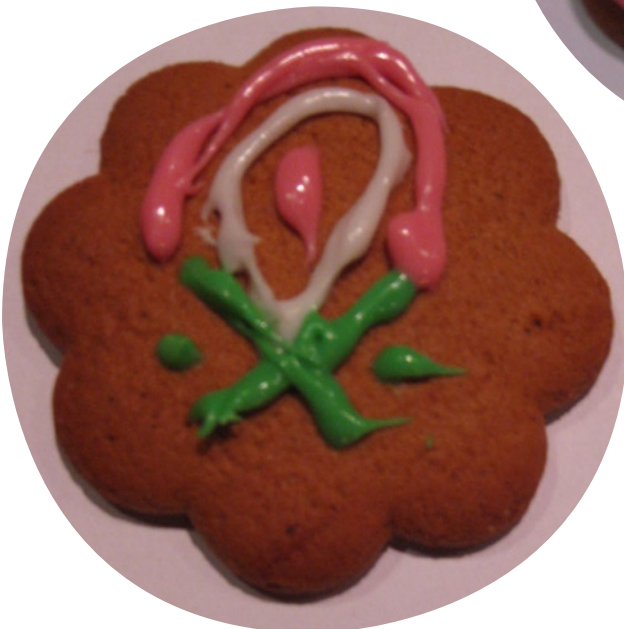
“Moderni laskuvarjo” Timo Mäkelä