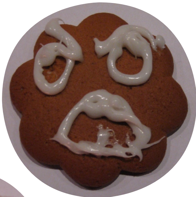
“FFFFUUUUUU” Teemu Leskinen