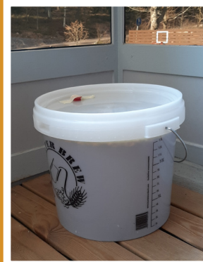
Viilennys ennen hiivausta