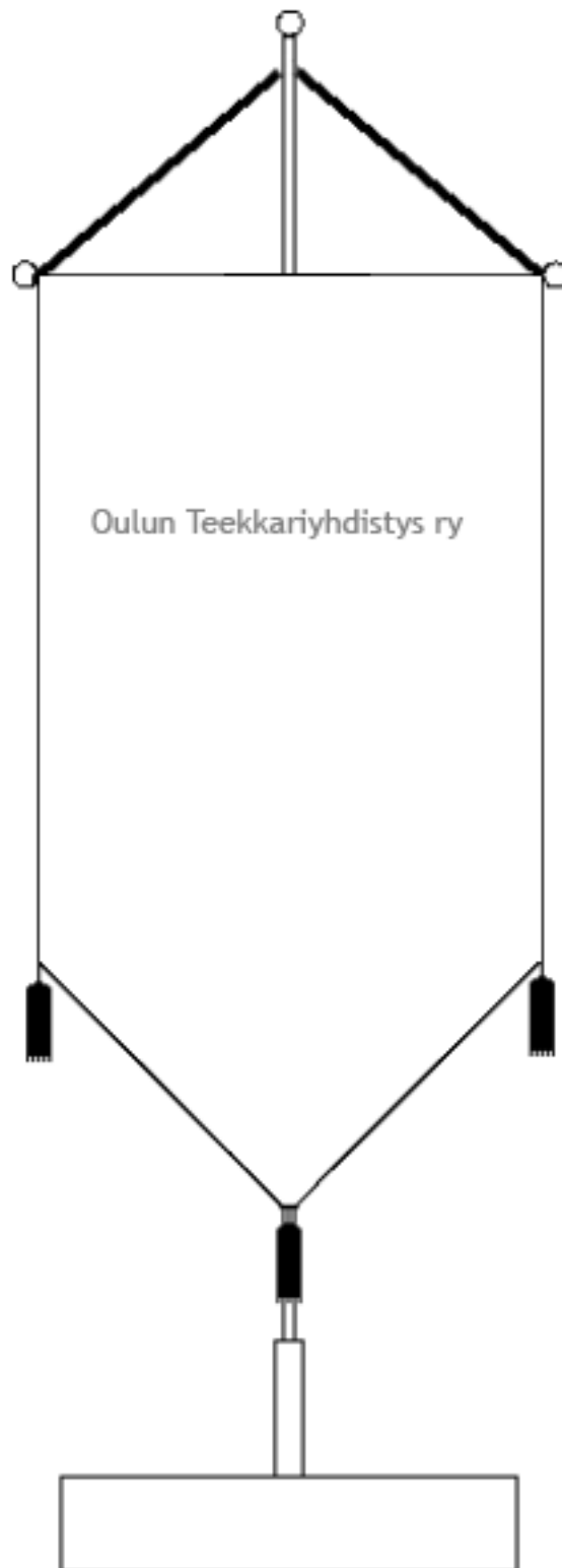
Kuva 3. Yhdistyksen standaari takaa