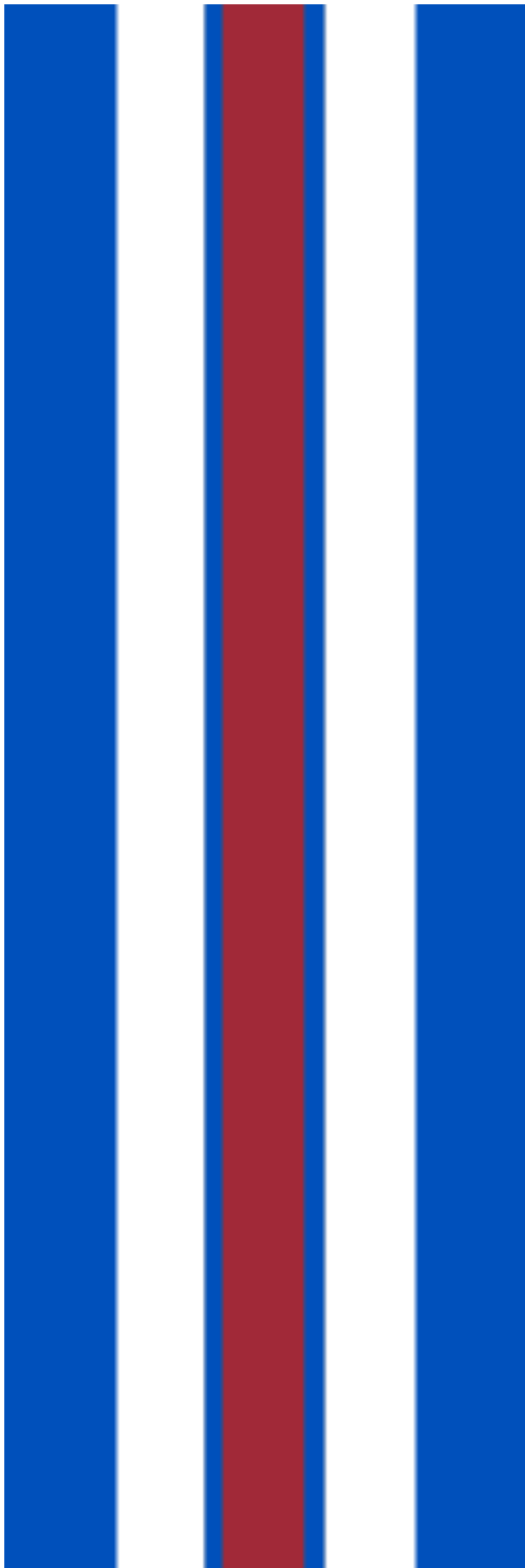
Kuva 1. Yhdistyksen virallinen nauha