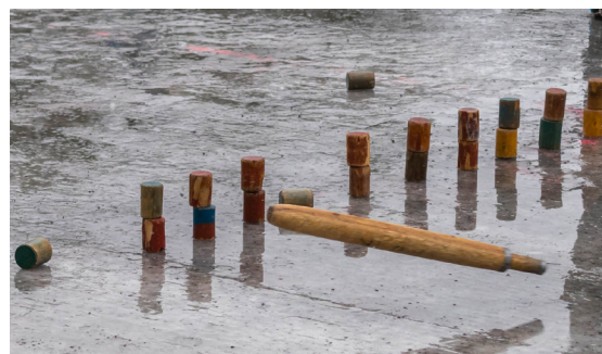
Kyykkiä ja karttu

Erityisesti Teekkareiden vaalima perinteikäs, etäisesti pesäpalloa ja keilaamista muistuttava joukkuelaji. Mailaa (karttua) heittämällä yritetään saada mahdollisimman monta kohdepalikkaa (kyykkää) ulos pelialueelta (ks. OAMK).