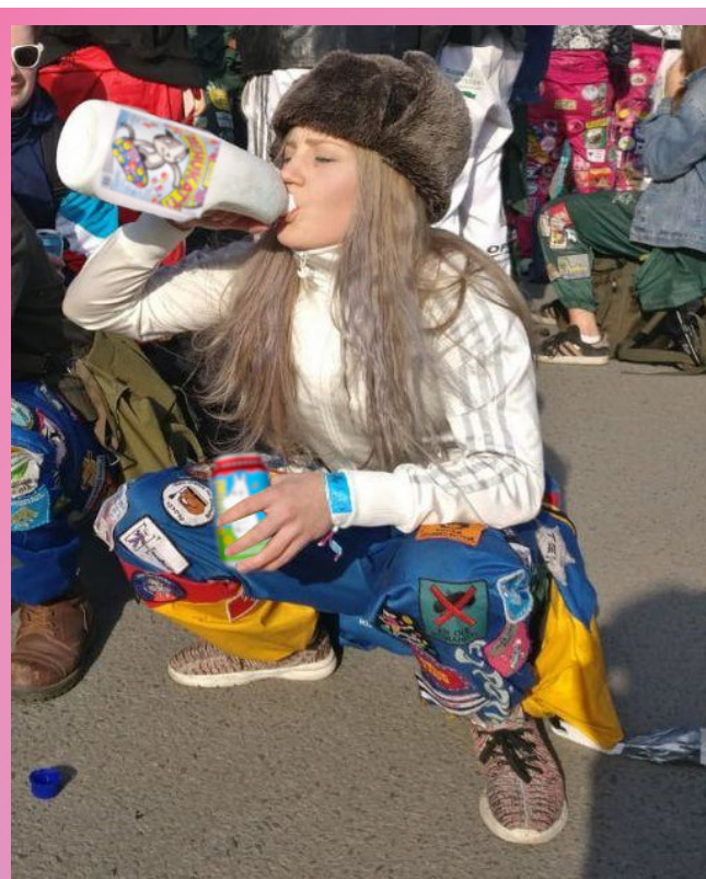
Isäntä nauttimassa auringonpaisteesta ja kylmästä juomasta Siberiabileiden jonossa 2019

Vaikka korona karsii perinteistä toimintaa ja asettaa haasteen teidän tulevien Teekkareiden Teekkariyhdistyksen integroitumiselle, toivon, että jaksatte lähteä mukaan toimintaan haasteista huolimatta. Yliopisto-opiskelu ei ole pelkkää puurtamista. Uusiin ihmisiin tutustuminen ryhmätöissä ja/tai järjestötoiminnassa johtaa hyvin usein pitkäaikaisten ystävien hankkimiseen. Ajattelutapa, että ammattiahan tänne vain on tultu hankkimaan, on mielestäni varsin surullinen. Silloin jättää hyödyntämättä monia mahdollisuuksia, joista on hyötyä ja varsinkin iloa myös valmistumisen jälkeen. Toivotan teidät tervetulleeksi yliopistoon ja erityisen lämpimästi tervetulleeksi OTYn tapahtumiin ja mukaan järjestötoimintaan!